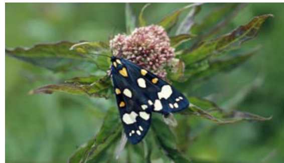
Nicht alle tagaktiven bunten Falter sind Tagfalter, z.B. der Schönbär. Seine roten Hinterflügel sieht man meist aber nur im Flug.

Sowohl die alten Einzelbände - mit allerdings schlechten Abbildungen - als auch die Auflagen als Sammelband sind nur noch antiquarisch, z.B. über ebay zu bekommen. Da es sehr farbenfrohe tagaktive Falter gibt, die dennoch zu den Nachtfaltern gehören, hat sich dieses Buch, in dem alle einheimischen Großschmetterlingsarten dargestellt sind, am meisten bewährt.