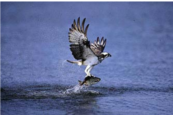
Lange Krallen ermöglichen den Fischfang

Der Fischadler ist größer als ein Mäusebussard. Durch die dunkelbraune Oberseite, den fast weißen Kopf und die leuchtend weiße Unterseite ist er leicht von anderen Greifvögeln zu unterscheiden. An den Kopfseiten zieht sich hinter den Augen beginnend ein dunkelbraunes Band hin, welches in das Rückengefieder übergeht. Auch dieser schwarz wirkende Augenstreif macht den Vogel unverwechselbar, ebenso wie der Schopf, in den die Federn des Oberkopfes auslaufen. Durch die abgewinkelten Flügel sieht der Adler von unten betrachtet wie eine große Möwe aus. Seine großen Fänge sind mit langen und starken Krallen versehen, die ihm den Fang glitschiger Fische ermöglichen.