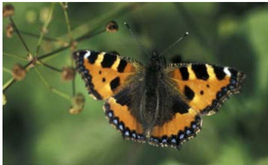
Schmetterlinge mit keulenförmigem Fühler sind Tagfalter. Beispiel hier: Kleiner Fuchs.

Was also ist mit den Schmetterlingen bei Regen? Sie verkriechen sich ins Trockene, genau wie die Menschen. Nur dass die Räumlichkeiten nicht ganz so komfortabel sind: unter loser Baumrinde, in Baumhöhlen, Rindenrissen, unter Totholz, Steinen, Blättern, in verwaisten Vogelnistkästen usw. Wäre es nur bewölkt gewesen, ohne Regen, dann hätten wir zumindest auf Nachtfalter achten können, die sich leicht aufscheuchen lassen. Zum Beobachten von Tagfaltern hätte die Sonne scheinen müssen, denn nur ein Sonnenbad bringt sie auf die nötige „Betriebstemperatur“.