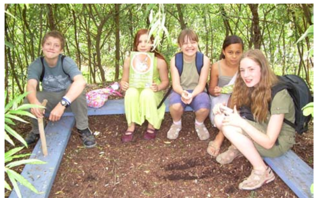
Die fünf großzügigen Jugendlichen der Glocksee-Schule

Im Juli besuchten fünf Schüler der Glocksee-Schule die Alte Feuerwache , um von den FÖJS zum Storchennest und zum Turm geführt zu werden. Anschließend haben sie dann gemeinsam noch an unserem Gartenteich gekeschert. Im Anschluss spendeten die fünf Jugendlichen dem NABU Laatzen 106 Euro - dafür bedanken wir uns natürlich ganz herzlich!!! (ms)