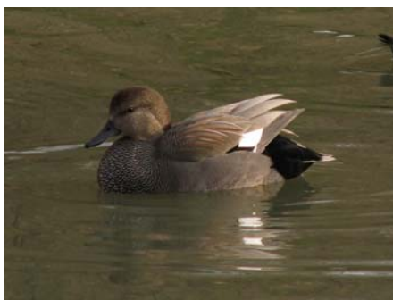
Schnatterente in der Nahaufnahme

Während der Exkursion konnten wir leider keine Schellenten beobachten, dafür jedoch andere Wintergäste aus den nördlichen Breiten, wie einen Singschwan, einen Gänsesäger und Hunderte von Bläßrallen. Außerdem natürlich viele Graugänse, die Stammform unserer Hausgans und damit auch der Weihnachtsgans.