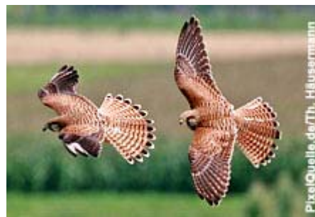
Zwei Turmfalken im Flug

Den Rüttelflug, gelegentlich auch als Standschwebeflug bezeichnet, setzen viele Vogelarten während der Nahrungssuche ein. Dabei bleibt die Position des Vogels in Bezug auf einen erdfesten Punkt unverändert. Der Flügelschlag ist schnell, der Schwanz meist breit gefächert und etwas zum Körper geknickt. Nicht nur Greifvögel beherrschen diese Flugtechnik, auch Kolibris, einige Fledermausarten und Libellen verstehen etwas vom Standschwebeflug.