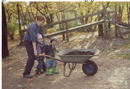
Der Humus wird herangeschafft

einer bestimmten Höhe zusammengebunden werden mussten. Hinzu kamen erschwerte Bedingungen die kleinen Helfer bei uns zu behalten, denn in jedem Spatenstich befanden sich zahlreiche Regenwürmer, die bei den Kindern für große Begeisterung sorgten. Nachdem die Ruten in den Gräben steckten, musste nur noch der vom Bauhof gespendete Humus mit vielen kleinen Eimern daraufgeschüttet und im Anschluss gegossen werden.