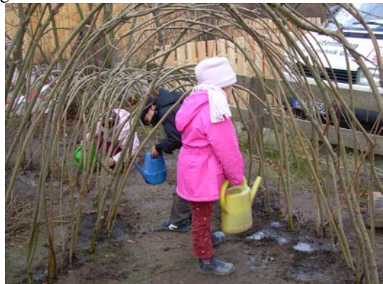
Fleißiges Gießen des neuen Weidentunnels

Nun können wir alle nur noch gießen und warten, dass die Weiden im Frühjahr grünen und sowohl der Weidenzaun als auch der Tunnel die Kinder begeistert.