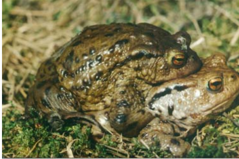
Zwei Erdkröten bei der Paarung

Wenn die Temperaturen im Frühjahr langsam ansteigen, begeben sich die Amphibien um sich zu fortpflanzen aus ihren Winterquartieren zu den Laichgewässern. Oft bedeutet es für sie den sicheren Tod, wenn sie dafür befahrene Wege überqueren müssen.