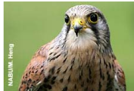
Der Turmfalke – ein stolzer Vogel