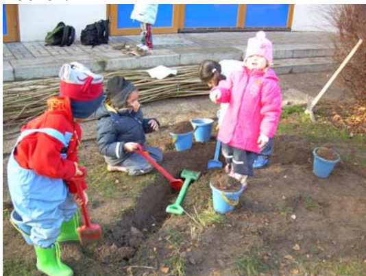
Viele Schaufeln in einem kleinen Graben

Nötig war zunächst ein Graben, der ca 30cm tief sein sollte, an dieser Stelle war der Boden sehr hart und machte es nicht einfach, aber mit Hilfe von vielen kleinen fleißigen Helfern schafften wir es schließlich.