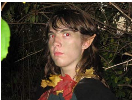
Bragi, die Baumelfe