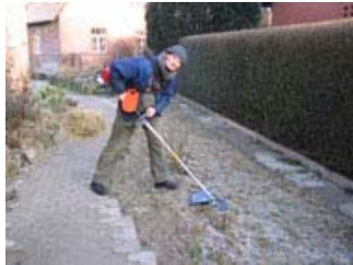
Michael Stülpner mit dem Freischneider

Die Motorsägen wurden bereits erfolgreich eingesetzt. Des Weiteren verwendeten wir ein Teil des Geldes für einen Freischneider mit abnehmbarer Astsäge und für neue Arbeitsschutzkleidung.